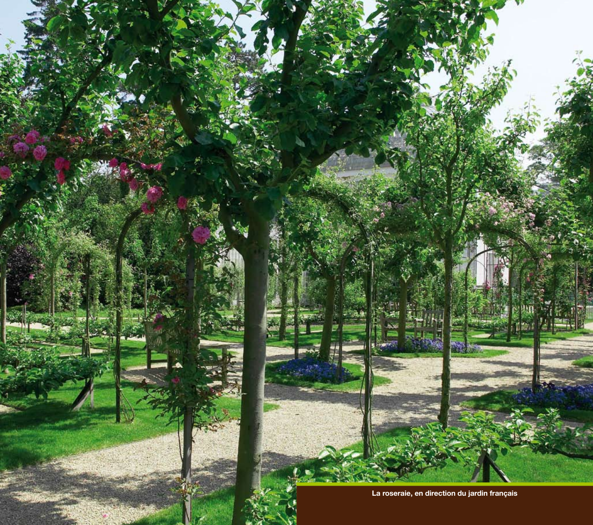
La roseraie, en direction du jardin français