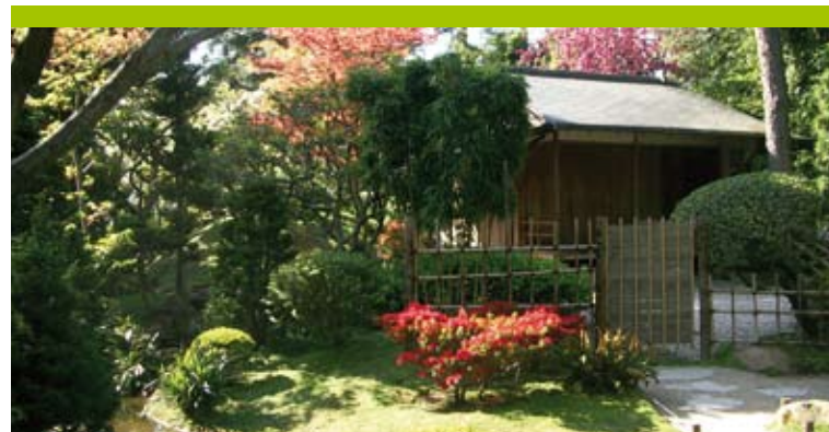
Une partie du village japonais

du XIX e siècle et au début du XX e siècle, à l'occasion des voyages d'Albert Kahn au Japon. Il comprend aujourd'hui un « village » bâti par des artisans japonais venus spécialement le réaliser. Pour ce faire, Albert Kahn fit livrer en pièces détachées les deux maisons d'habitation et des végétaux japonais dont une collection de bonsaïs. Le jardin contemporain a remplacé en 1990 une partie des anciens jardins. Le paysagiste Fumiaki Takano y a néanmoins conservé le pont rouge et le portique donnant sur le verger. Ce nouveau jardin symbolise la vie et l'œuvre d'Albert Kahn, de sa naissance à sa mort, ainsi que ses liens d'amitié avec le Japon. L'eau y est omniprésente. D'autres évocations du Japon sont présentes comme la montagne aux azalées qui représente le Mont Fuji.