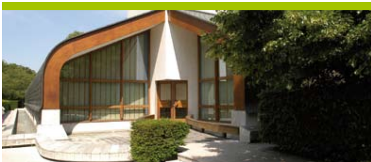
L'entrée du musée