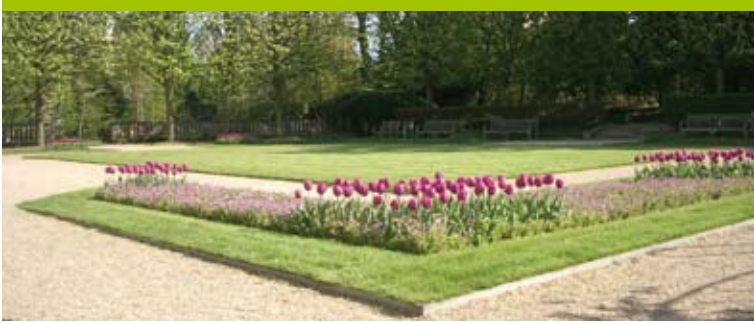
Les pelouses du jardin français